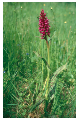
prstnatec májový ( Dactylorhiza majalis )

Bílé Karpaty představují mimořádnou oblast mezi našimi velkoplošnými chráněnými územími především proto, že jsou nejvyšším pohořím jihozápadního okraje vlastního karpatského horského systému. Celá oblast, ale zejména její jižní část, byla po mnoho staletí kultivována člověkem. Přesto, nebo právě proto se zde dochovaly mimořádně cenné přírodní hodnoty a na mnoha místech lze hovořit o harmonické krajině.