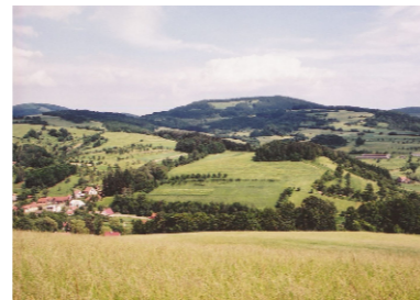
Krajina na Nedašovsku