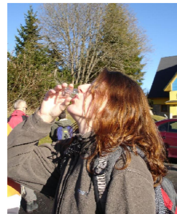
Tož vítajte u nás...

Přijměte pozvání na naučné stezky Bílých Karpat! Provedou vás mnoha zajímavými místy tohoto pohorí, přiblíží vám krásy zdejší přírody i lidové kultury a možná vám přinesou i trochu poučení. V jižní části Bílých Karpat se můžete kochat rozsáhlými komplexy květnatých luk. Tyto louky patří co do počtu rostlinných druhů k nejbohatším v Evropě. Střední část, zvaná Moravské Kopanice, Vás okouzlí pestrou mozaikou rozptýlených stavení, políček, sadů, luk, pastvin a remízků. Možná na Vás dýchne i trochu mystická atmosféra tohoto kraje, vždyť ještě nedávno tu žily vědmy, které bylinkami a zařikáváním dokázaly přivolat lásku, ale i zlé noční můry. Severní část Vám nabízí chodníky vedoucí majestátnými bukovými lesy nebo lázeňskou kolonádu v Luhačovicích. Po procházce Bílými Karpaty zjistíte, jak mimořádně pestrá je zdejší příroda i lidová kultura. Právě proto byla v roce 1979 vyhlášena CHKO Biele Karpaty na jejich slovenské straně a v roce 1980 CHKO Bílé Karpaty na moravské straně. Přírodní a kulturní hodnoty Bílých Karpat byly oceněny i mezinárodně, když je v roce 1996 prohlásilo UNESCO Biosférickou rezervací a když v roce 2000 získaly Diplom chráněných území od Rady Evropy.