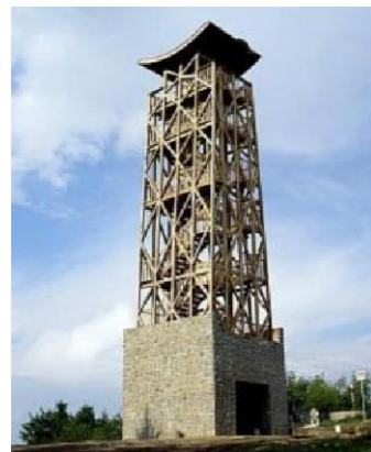
Rozhledna na Velkém Lopeníku