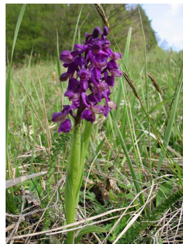
vstavač obecný (Orchis morio)