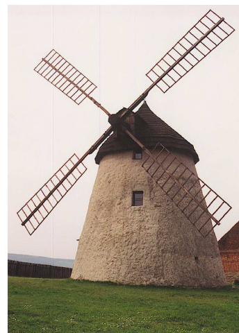
Kuželov, větrný mlýn