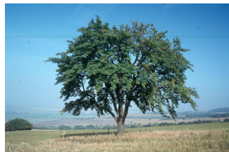
Tvarožná Lhota, oskeruše